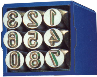
NO. 200 (SR) รูนเป็นกลม (ทั่วไป)