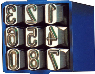
NO. 240 (GS) รูนเป็นสี่เหลี่ยม