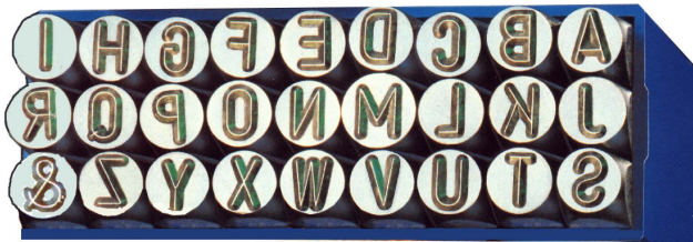
NO.245 (GS) รูนเป็นสี่เหลี่ยม